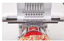
Bastidor "one point".