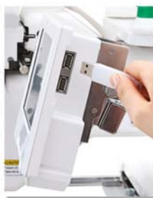
Pendrive e Mouse