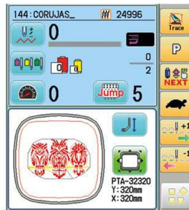
Comandos a um toque de distância.