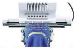
Bastidor de bonés amplo.