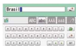
Teclado virtual facilita digitação.