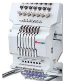
Passagem de linha simplificada