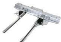
Prendedor de bolsa.