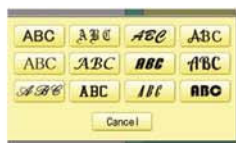
12 fontes/6 tamanhos