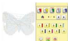
Paradas e corta fio com fácil programação.