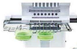
Bastidor de meias.