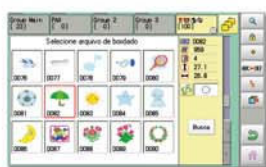
Administra diretórios de forma gráfica.