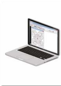
Softwares Happy Link e Happy LAN