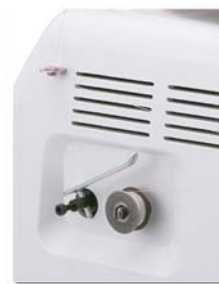
Enchedor de bobina incorporado