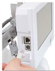
Conexão USB e Rede